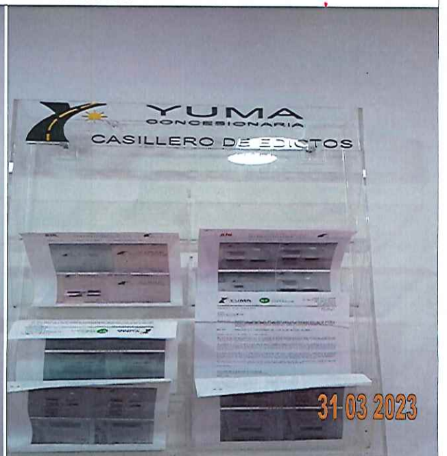
EDICTO R_36801 YC-CRT-125709